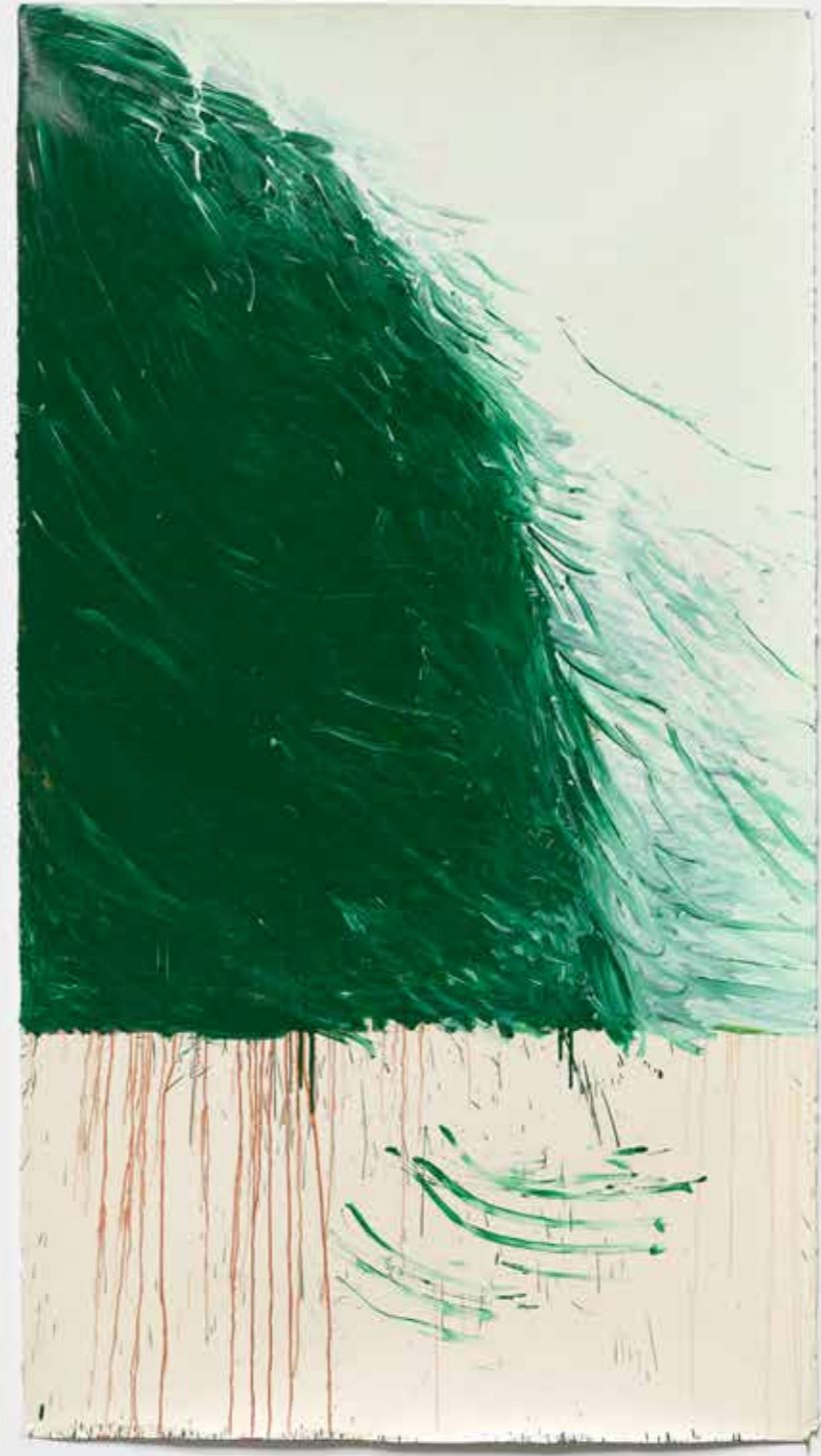
Green Painting IV , 2021-22, óleo sobre papel, 227 x 124 cm