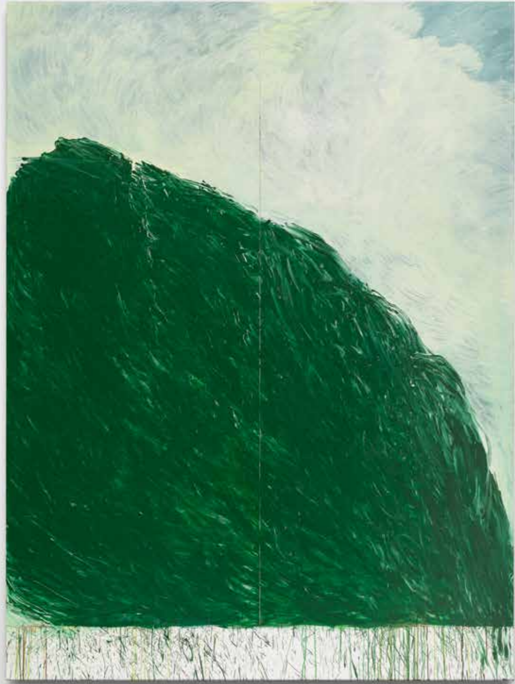
Green Painting II , 2021-22, óleo sobre tabla, 265,5 x 200 cm