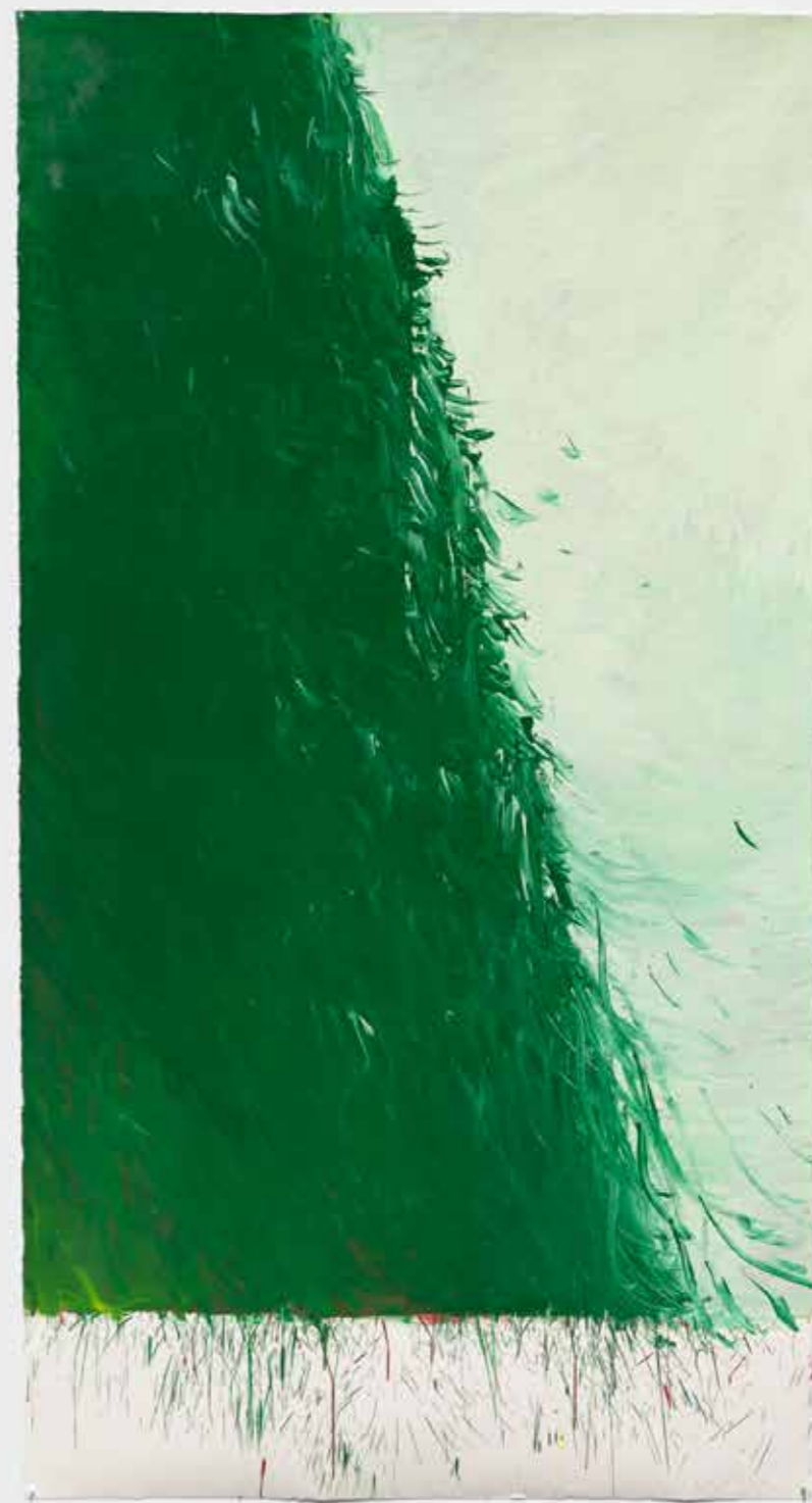
Green Painting VI , 2021-22, óleo sobre papel, 231 x 124 cm