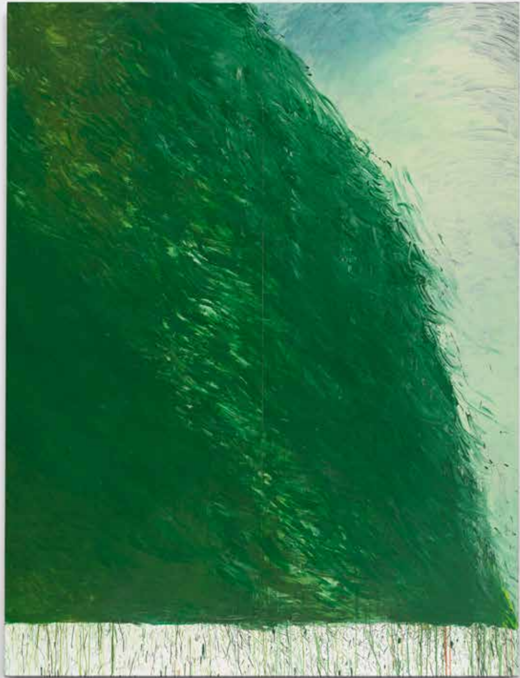
Green Painting V , 2021-22, óleo sobre tabla, 265,5 x 200 cm