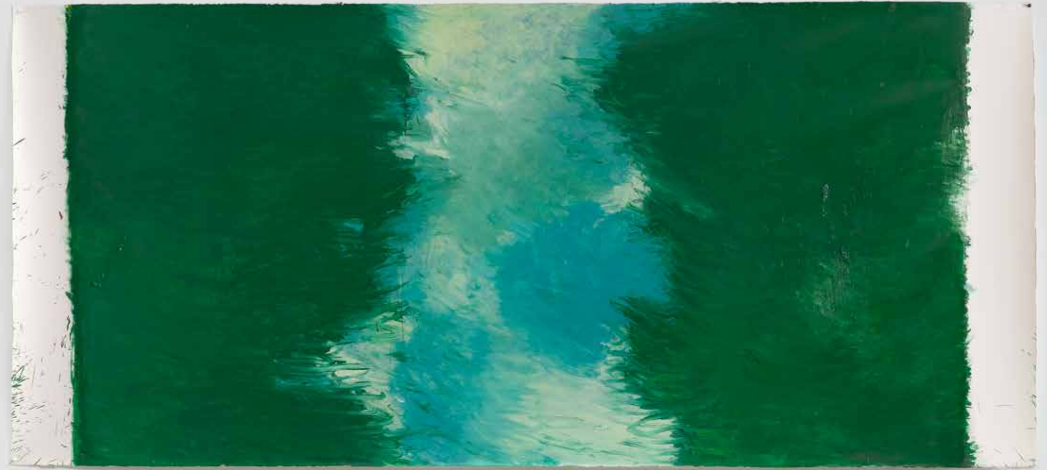
Green Painting III , 2021-22, óleo sobre papel, 124 x 266,5 cm